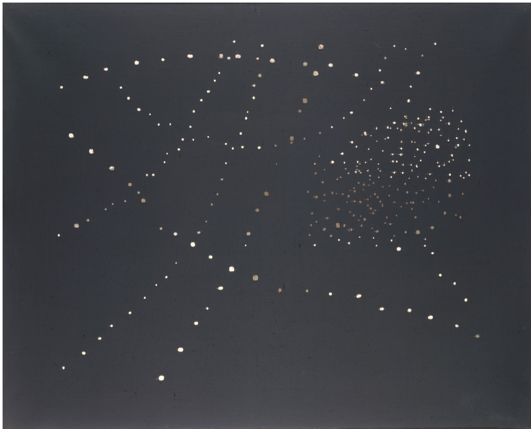
Lucio Fontana. Concetto spaziale [Concepto espacial] (50 B 1) , 1950 © Lucio Fontana a través de SIAE 2022