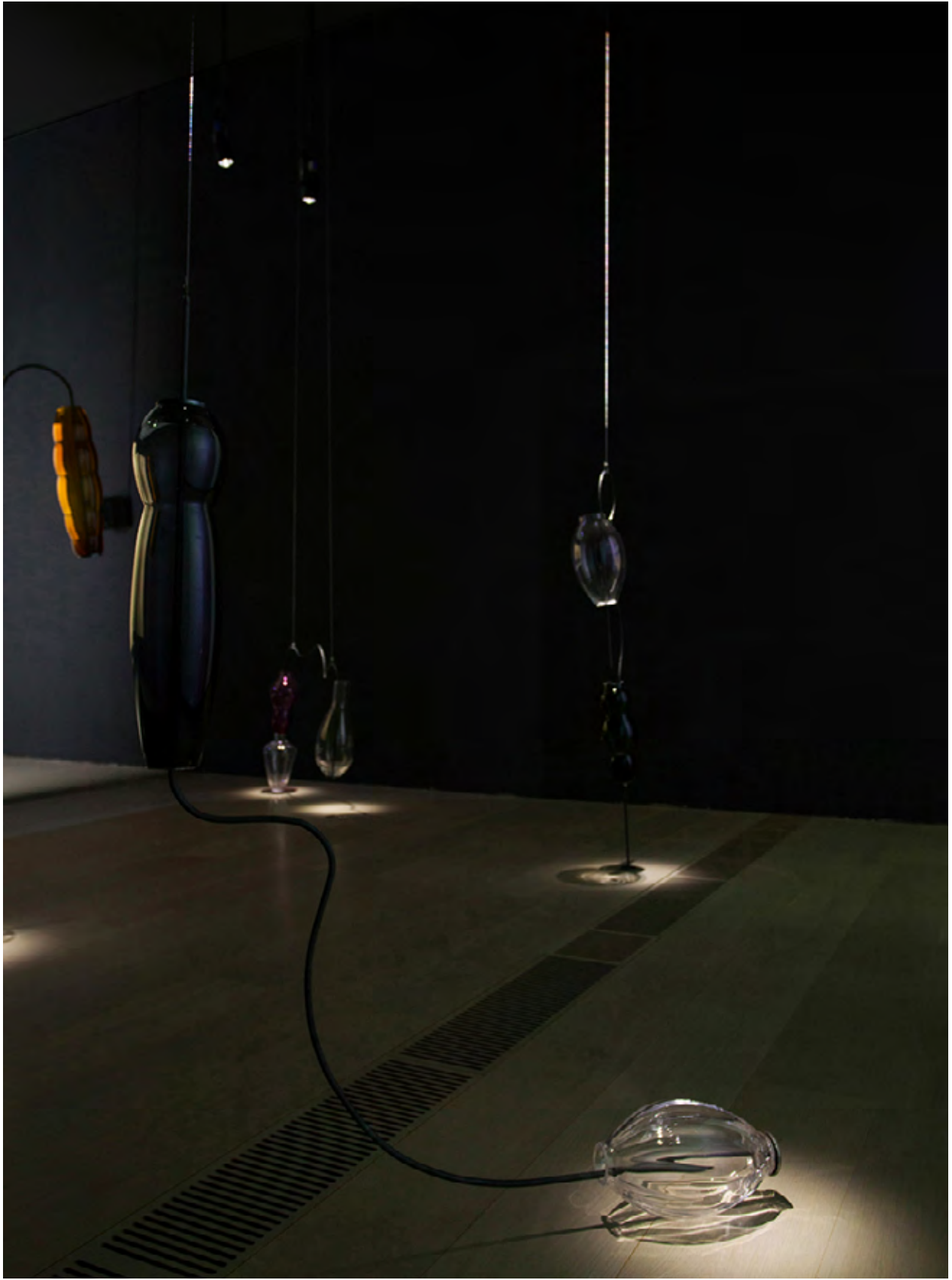
Leonor Serrano Rivas, The Dream of the Mouth n° 10 , 2018

Danzar en el museo, ¿es eso lo que queréis?