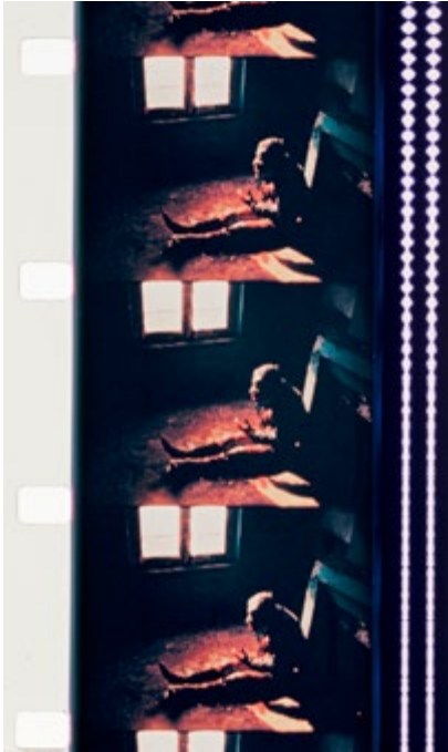
L'Homme qui tousse [El hombre que tose], 1969

Películas de 16 mm digitalizadas, en blanco y negro y a color, sonoras Compras, 1975