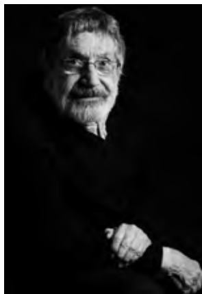
Carlos Cruz-Diez, Paris, France, 2011 Photo: © Alexandro Pelaez © Carlos Cruz-Diez / Bridgeman Images 2024

© Carlos Cruz-Diez / Bridgeman Images 2024