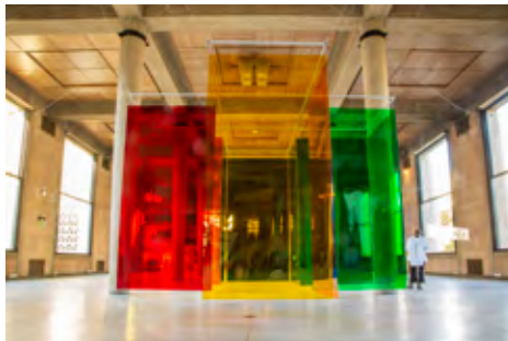
Carlos Cruz-Diez, Labyrinthe de transchromie B, 1969-2017 Vue de l'exposition « Suspension. Une histoire aérienne de la sculpture abstraite. 1918-2018 », Palais d'Iéna, Paris, 2018

Si l'optico-cinétisme se développe principalement en Europe, plusieurs de ses principaux représentants sont sud-américains : l'Argentin Julio Le Parc et les Vénézuéliens Jesús-Rafael Soto et Carlos Cruz-Diez, qui vivront tous à Paris. L'exposition itinérante de Vasarely en Amérique latine en 1959 exerce une influence importante sur toute une génération d'artistes.