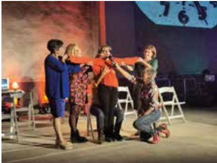
© El Silencio de lo viejo

A través de las artes escénicas, este taller propone una reflexión sobre el concepto de “edadismo” o discriminación por edad. Partiendo de técnicas de movimiento espontáneo, del trabajo con objetos y de la auto-ficción, se invita a crear en el espacio y a dar voz a una pieza sonora que formará parte de la exposición Hors Pistes. Las edades de la imagen .