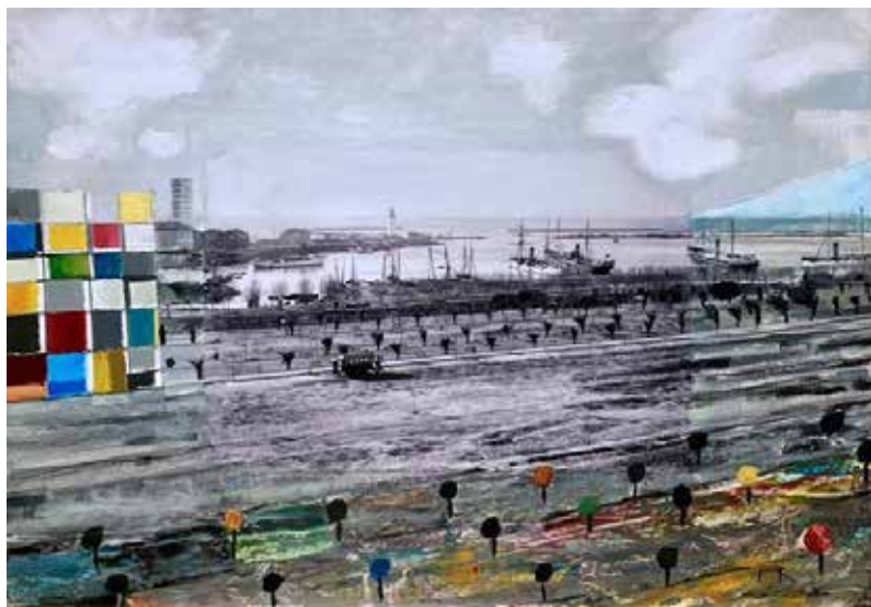
Fernando de la Rosa, Paysage à suivre... (I, II y III) , 2022. Tinta calcográfica y óleo sobre fotografía. Impresión láser sobre papel satinado.