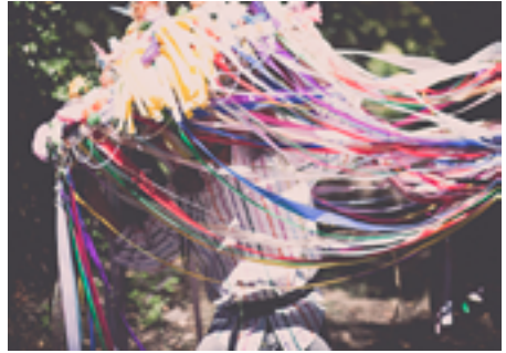
Viva la guerra © Marina M. Luna.

La acción tendrá una primera parte conferenciada en la que Alberto Cortés y Luz Prado nos invitan a una ceremonia de memoria y despedida de su performance original Viva la Guerra ; y una segunda parte en la que presentan el devenir de aquel proyecto en su forma actual: La Panda ,