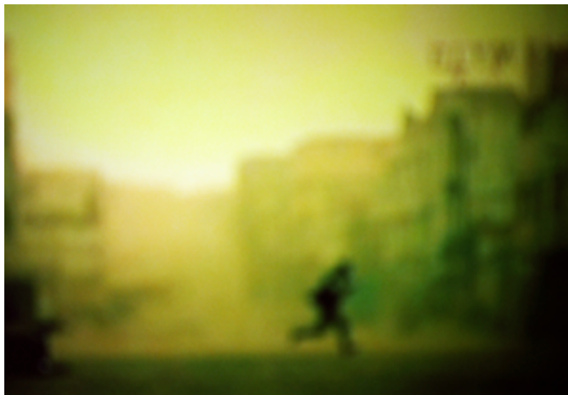
François Fontaine, Witness , 2017. Impresión fotográfica digital