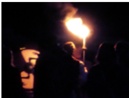
© Arnaud Dezoteux y Celsian Langlois

Los artistas Arnaud Dezoteux y Celsian Langlois grabaron las secuencias y bandas sonoras de un juego de rol a escala real Las leyendas de Hiboria , en el que también participaron. Negociaciones ofrece una versión de esto en forma de instalación, compuesta por retazos de conversaciones, de fragmentos de negociaciones políticas o de banalidades cotidianas. Las situaciones grabadas revelan la naturaleza polifónica y fragmentada de la guerra. El público se encuentra en el centro de un juego complejo, no polarizado, en el que los jugadores viven la historia mientras la escriben.