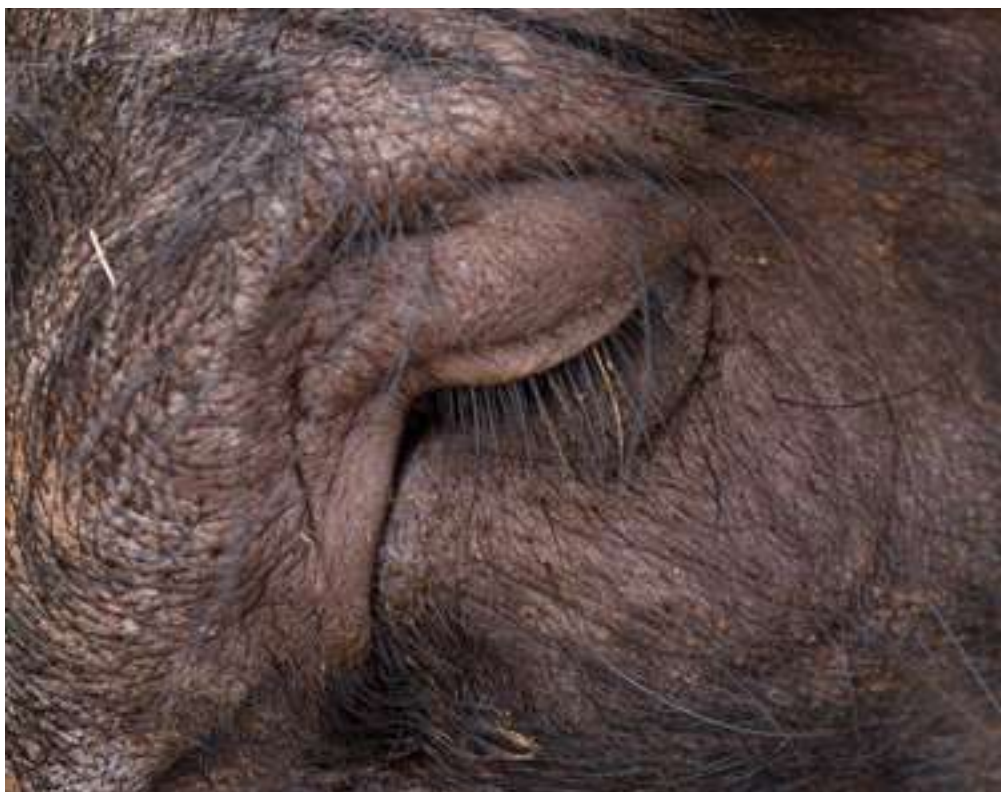
Ruth Montiel Arias, Sonidos para una utopía , 2015 (detalle). Fotografía sobre papel Hahnemühle, 160 x 108 cm. © Ruth Montiel Arias