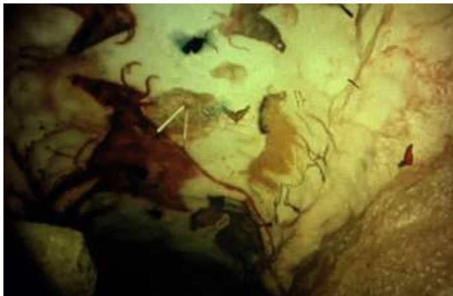
© Clément Cogitore, VEGAP, Málaga, 2025

Después de estudiar en la Escuela Superior de Artes Decorativas de Estrasburgo y en el estudio nacional de artes contemporáneas Le Fresnoy, Clément Cogitore desarrolla una obra que combina películas, instalaciones, vídeos y fotografías. Su obra cuestiona las formas en que las personas conviven con sus imágenes, y explora los rituales, la memoria colectiva, la figuración de lo sagrado y una cierta idea de la permeabilidad de los mundos. En 2019, el artista dirigió la ópera Les Indes galantes (Las Indias galantes), de Jean-Philippe Rameau, en la Ópera de París, una producción aclamada por la crítica. Ganador del Premio Marcel Duchamp en 2018, actualmente es profesor en la Escuela Superior de Bellas Artes de París.