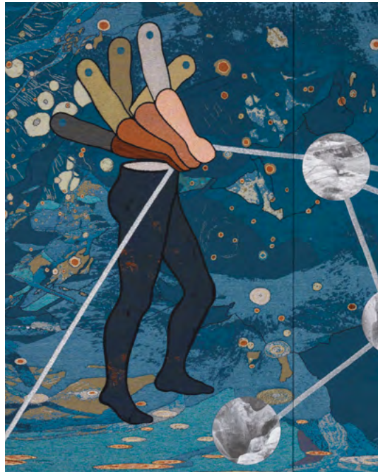
Otobong Nkanga, The Weight of Scars , 2015 (detalle)

Aunque una gran diversidad de personas recorre el espacio público, el individuo tiende a mezclarse con una multitud densa y uniformizada. Esta parte de la exposición da mayor protagonismo a grupos de figuras anónimas que cualquiera puede encontrar fuera de casa. En algunas obras, la ausencia de seres humanos permite percibir mejor las señales de su existencia y su presencia. El espacio público también se ha convertido en un campo de juego para muchos artistas, especialmente a través de la performance. Lo ocupan para revelar y desafiar los usos regulados y la violencia que se manifiestan en él.