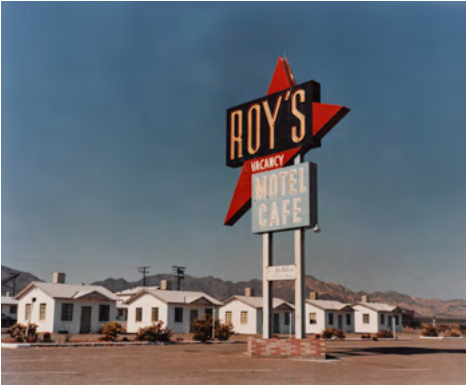
Wim Wenders, "Vacancy", Amboy, California, 1983. Impresión por destrucción de colorantes, 29,8 x 35,6 cm.