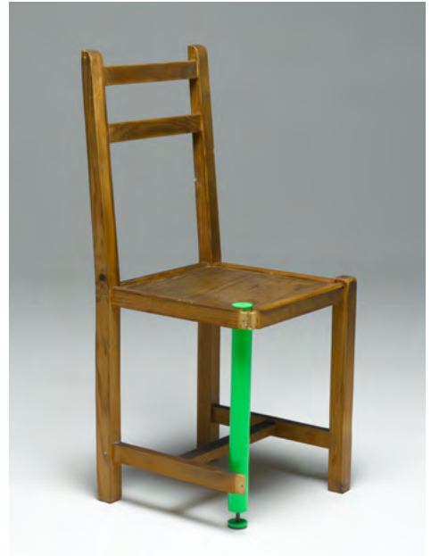
Studio 5.5, Chaise soignée avec béquille , 2004. Silla recuperada y soporte de acero lacado en verde, 95 × 45 × 45 cm.

Esta primera parte del recorrido pretende ir más allá de esta dicotomía entre ciudad y campo al presentar diversos puntos de vista sobre la vida rural y urbana. Escenas de trabajo agrícola, vistas campestres o desviaciones del género paisajístico se mezclan con obras que ilustran la rápida evolución de las ciudades desde finales del siglo XIX, la organización espacial de las ciudades modernas o incluso los incesantes flujos de las megalópolis contemporáneas.