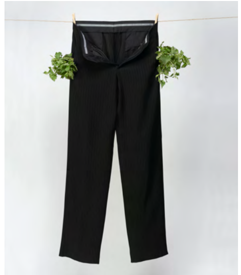
Mircea Cantor, Tasca che punge , 2007. Pantalón Armani, ortigas, tierra, cuerda y pinzas de madera. Dimensiones variables.

Algunos artistas abordan desde el condicionamiento hasta la sobreproducción y el consumismo excesivo, mientras que otros se apoderan de objetos banales de los que está saturada nuestra sociedad para revelar su poder simbólico o transformarlos en remanentes absurdos del consumo de masas. La forma en la que habitamos el espacio está influenciada por un marco económico, flujos de información e intercambios incesantes. El resultado es una forma de sometimiento a nuestros sistemas de producción industrial y nuestro entorno tecnológico, que dañan nuestros cuerpos y controlan nuestras emociones.