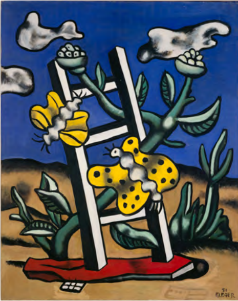
Fernand Léger, Deux papillons jaunes sur une échelle , 1951. Óleo sobre lienzo, 92 × 73 cm. © Centre Pompidou, MNAM-CCI/Jacques Faujour/Dist. RMN-GP © Fernand Léger, VEGAP, Málaga, 2023