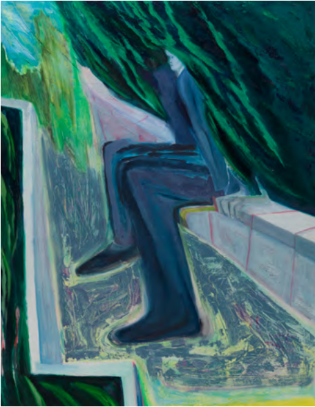
Firenze Lai, Lunch Breaks , 2016. Óleo sobre lienzo, 110 x 85 cm.

A través de un diálogo fructífero entre reinterpretaciones singulares de paisajes, se lee entre líneas toda la ambivalencia de esta noción, que se encuentra en la encrucijada de lo natural y lo social, de lo íntimo y lo político. Estas obras nos invitan a comprender la complejidad de nuestro mundo globalizado y, al mismo tiempo, abren infinitas posibilidades. Cuestionan nuestras certezas y nos recuerdan que el territorio también puede concebirse fuera de su anclaje físico para ser comprendido como un espacio mental.