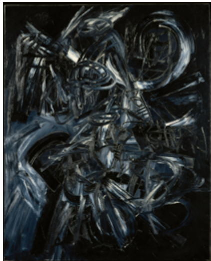
Antonio Saura, Inès , 1957. Huile sur toile, 162 x 130 cm

Reprenant le titre d'une exposition de la Galerie Maeght en 1946, cette section réunit des artistes abstraits qui recourent à la sobriété et à la solennité du noir. Au sortir de la guerre, Pierre Soulages se fait connaître par d'épais signes calligraphiques peints au brou de noix, qui inaugurent une production dédiée presque exclusivement à la couleur noire. Tout comme André Marfaing , Soulages en explore toutes les potentialités expressives et plastiques dans de forts contrastes avec le blanc. Ce minimalisme chromatique rend encore plus visible le vocabulaire gestuel des artistes et les qualités plus ou moins ductile de la matière. Inspiré par la musique, Gérard Schneider est adepte de vigoureux coups de brosse, tandis que Hans Hartung agrandit sur la toile ses encre sur papier. L'opposition entre le noir et le blanc peut également instiller un sentiment de gravité, voire de tragique, comme dans l'œuvre d' Antonio Saura qui convoque le souvenir de la grande peinture baroque espagnole.