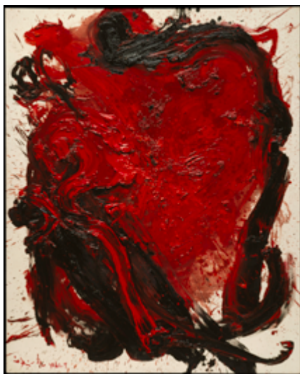
Kazuo Shiraga, Chizensei Konseimao (Planète Nature), juillet 1960. Huile sur toile, 161,5 x 130 cm

« Ma peinture devient illisible. Natures mortes et fleurs n'existent plus. Je tends vers une écriture imaginaire, indéchiffrable. »