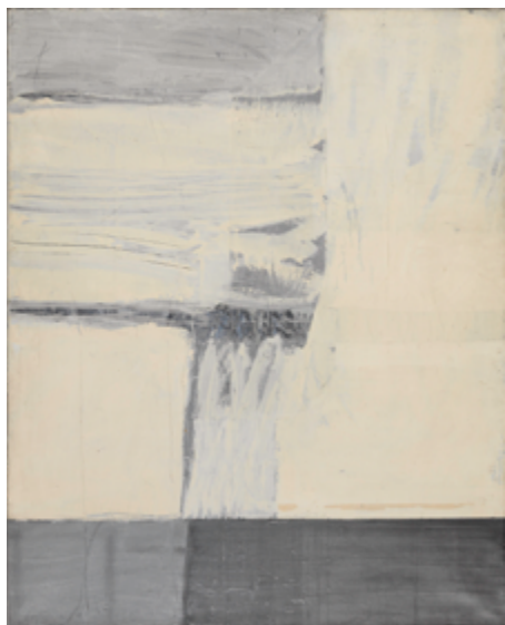
Michel Parmentier, Peinture n°6 , 1963. Huile, cire, crayon et papiers collés sur toile, 162 x 130 cm

Tout au long des années 1950, un dense réseau de galeries, de revues et de critiques internationaux assure la diffusion et la promotion de l'abstraction gestuelle, qui devient un langage commun dans toute l'Europe. Dans l'Espagne franquiste, avec Manolo Millares , comme dans la Pologne communiste, avec le futur dramaturge Tadeusz Kantor , cette esthétique est perçue comme un espace de résistance aux dogmes culturels dominants. En Allemagne de l'Ouest, la peinture d' Ernst Wilhelm Nay se présente comme un exemple de liberté artistique face à la politique culturelle est-allemande, hostile par principe à l'abstraction. Dès le milieu des années 1960 cependant se fait jour un épuisement de la peinture gestuelle et matiériste alors que s'amorce un retour du figuratif avec le Pop art aux États-Unis, le Nouveau réalisme et la Figuration narrative en France, ou encore Equipo Crónica en Espagne. De manière significative, la peinture de Michel Parmentier qui conclut cette exposition assure la transition entre ce langage gestuel et des approches plus radicales et minimales de l'abstraction.