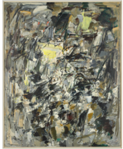
Joan Mitchell, Sans titre , 1954. Huile sur toile, 254 x 203,7 cm

« Sur le sol, je suis plus à l'aise. Je me sens plus proche, plus partie intégrante du tableau, puisque de cette façon je peux marcher autour, travailler des quatre côtés et être littéralement dans le tableau. »