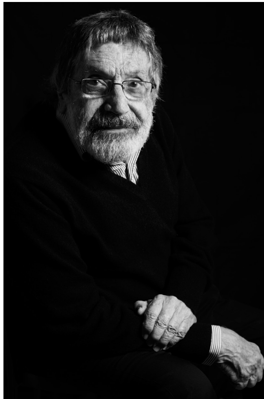
Carlos Cruz-Diez, París, Francia, 2011 Foto: © Alejandro Peláez © Carlos Cruz-Diez / Bridgeman Images 2024