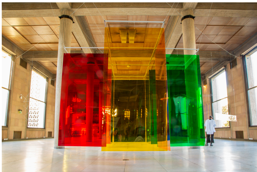
Carlos Cruz-Diez, Labyrinthe de transchromie B, 1969-2017 Vista de la exposición «Suspension. Une histoire aérienne de la sculpture abstraite. 1918-2018», Palais d'Iéna, París, 2018