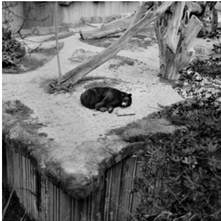
© Estela de Castro, VEGAP, Málaga, 2025

Con esta serie fotográfica Estela de Castro denuncia el encierro que sufren los animales en los parques zoológicos. La falta de libertad provoca conductas estereotipadas y repetitivas, desencadenando en los animales el denominado síndrome Zoocosis. La actitud antropocéntrica reduce la vida animal a espectáculo, niega su mundo interior y construye ficciones de «naturaleza controlada». Estas fotografías se convierten en una suerte de radiografía emocional, un áspero muestrario de seres que no pueden hablar, pero sí gritar desde el silencio de una imagen, atrapados en un sueño que no es suyo, sino humano: el sueño de dominarlos, domesticarlos, convertirlos en decoración viva. ¿Acaso son ensoñaciones del mundo natural que les fue arrebatado? El sueño del hombre de ser dios y la pesadilla del animal que despierta cada día sin cielo, sin tierra, sin salida.